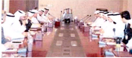
الحربي والمضف خلال الاجتماع مع مسؤولي التطبيقي

أكد وزير التربية وزير التعليم العالي د. سعود الحربي ضرورة توفير الخدمات الوقائية التي يحتاجها الطلبة في حال استئناف الدراسة وتوعيتهم اعلاميا وتعليميا باهمية منع التجمعات لما لها من مضار سلبية.